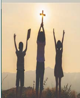
Copyright © J.S. Paluch Co. Inc. Excerpts from the Lectionary for Mass © 2001, 1998, 1997, 1986, 1970, CCD.